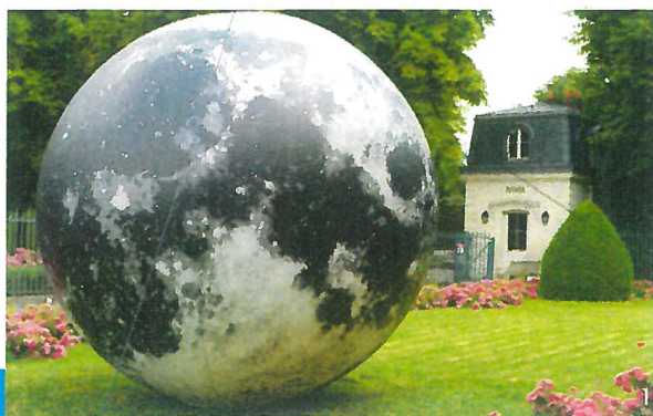
↑ « Globule Ubiquity Vibrations », Bruno Peinado.